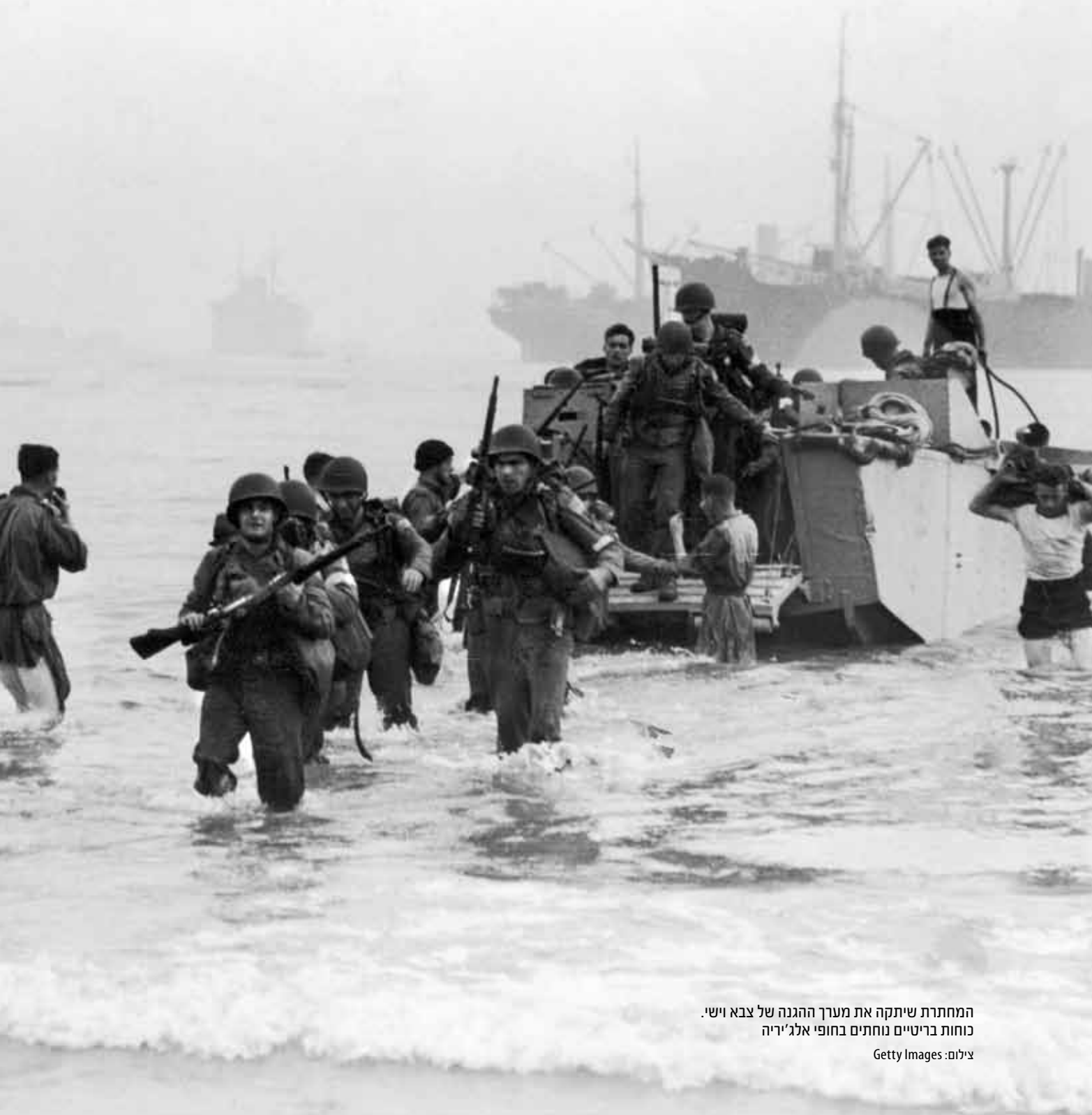
המחתרת שיתקה את מערך ההגנה של צבא וישי. כוחות בריטיים נוחתים בחופי אלג'יריה